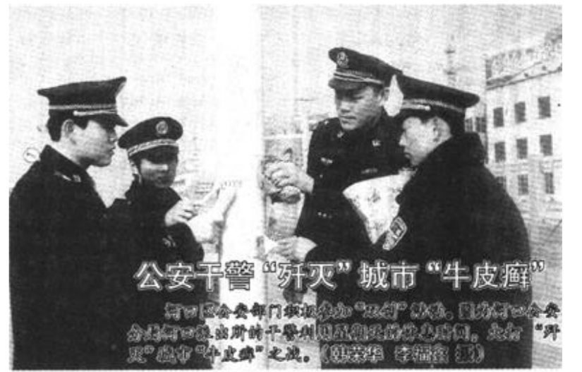
公安干警“歼灭”城市“牛皮癣”

共建双方表示,结成双拥共建对子以后一定要在业务上多关心和支持,进一步共建载体,探索灵活有效的形式,开展丰富多彩的活动,不断增强双拥工作的活力;将在注重实效上下功夫,围绕发挥各自优势,整合各类资源,实现共同发展,围绕促进全市建设和发展,围绕推动社会文明进步,扎扎实实开展