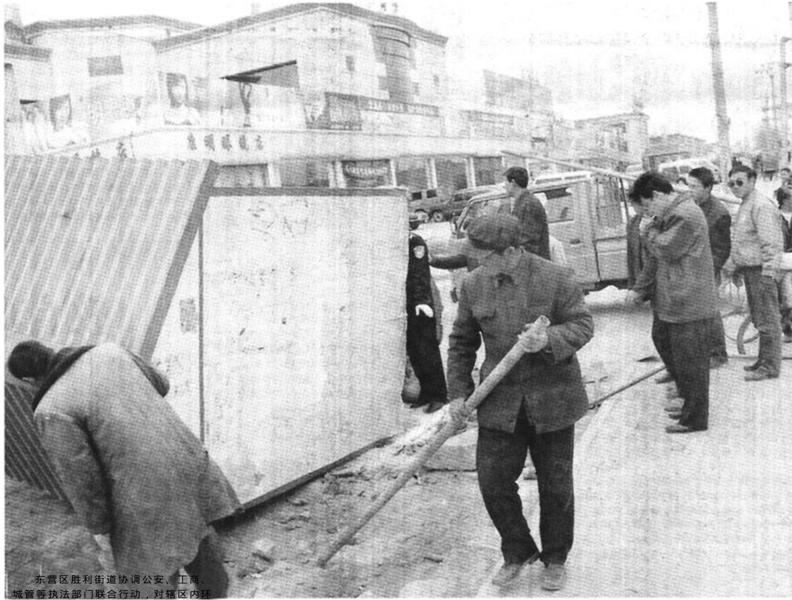
东营区胜利街道协调公安、工商、城管等执法部门联合行动,对辖区内环境、卫生及街道两旁乱搭乱建的违章建筑予以整治清理,确保“双创”工作稳步推进。

系,建立县局领导、机关科室、基层分局三级税收服务网络,制定服务目标,明确服务职责,落实监督管理。二是确立崭新的国税理念。他们把“敬业报国、诚信为民”树为国税的精神,把“执法如山、循规蹈矩”作为执法理念,把“规范有序、张弛有度”作为管理理念,把“为纳税人服务是天职”作为服务理念,把“在团队中实现自我”树为价值观,把“让纳税人满意、让政府放心”为责任观,把“建成卓越的税收管理机构,为促进社会的繁荣、安定做出贡献”作为抱负。三是在全社会和广大纳税人中开展“阳光评税”“税情恳谈”等活动,把国税机关和每一名干部一言一行融入税收服务中,让群众和纳税人打分,把税收服务置身于全社会的有效监督之下。在县人大、政协、纪委、公、检、法、司等部门组织的综合测评中连续七年获全县第一名。(朱丹)