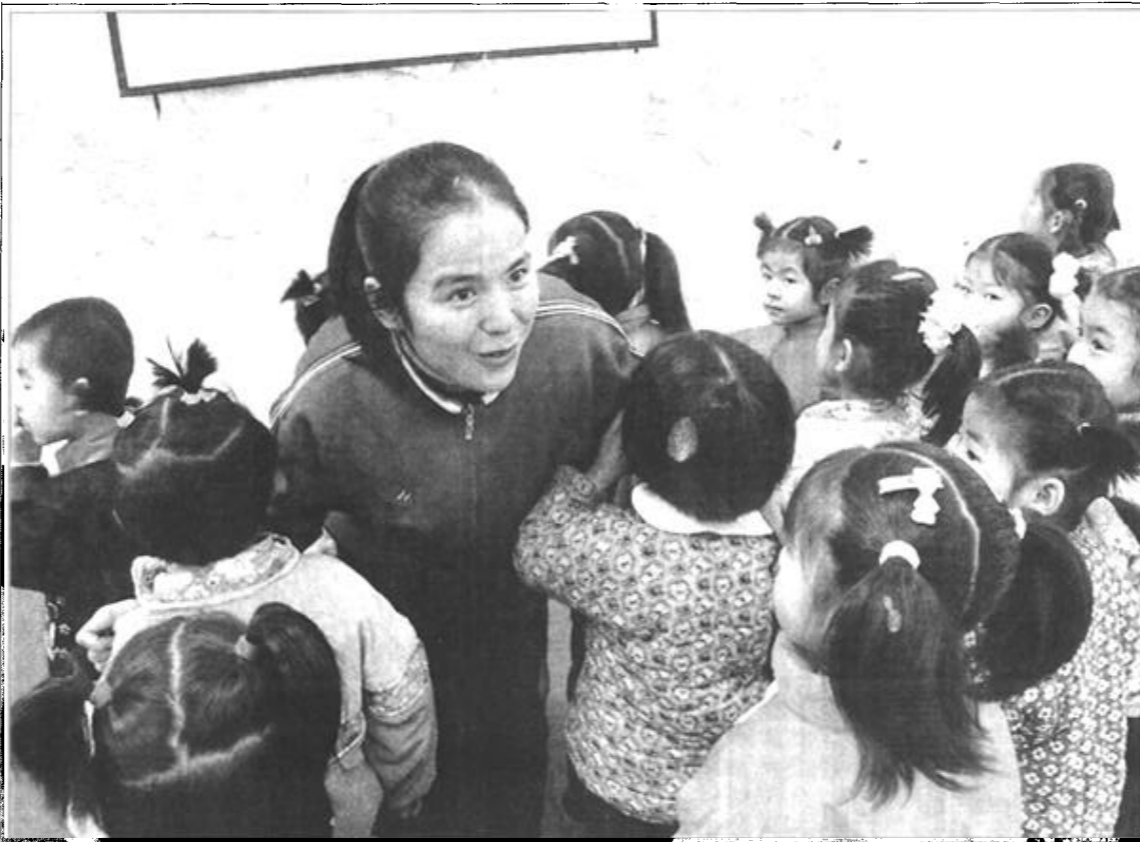
利用多媒体进行教学并不稀奇，可利用多媒体进行幼儿教育却是新鲜事。利津县实验二幼舍得投资，引进了多媒体、计算机等先进设备进行幼儿教育，收到了很好的效果，被评为省级示范幼儿园。

芦葦产业快速发展 河口讯 河口区充分提高群众投资开发苇场的积极性，鼓励广大农民群众开发荒滩地。同时加强引导，鼓励广大群众异地开发，现已形成了一支庞大的异地开发大军，遍布沿渤海的寿光、沾化、垦利、无棣等地区。苇场开发面积已达8.5万亩。截至目前，全区以入股、参股、控股等形式组建的苇板生产厂家有36家，总投资达750万元。2002年，芦葦批发生场交易量达10万吨，交易额达3400万元。(王玉广 陈立涛)